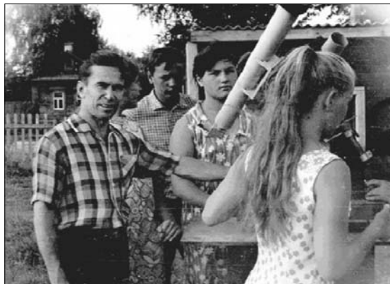
Астрономический кружок готовится к наблюдениям

три раза были участниками ВДНХ СССР. 22 юных астронома были награждены медалями «Юный участник ВДНХ», а более 60 учащихся удостоены дипломов и почетных грамот областных и городских выставок. Этот школьный астрономический кружок был одним из лучших в СССР.