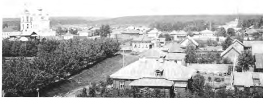
Вид на церковь Преображения Господня