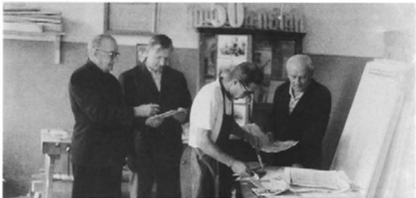
Так готовились экспонаты будущего музея