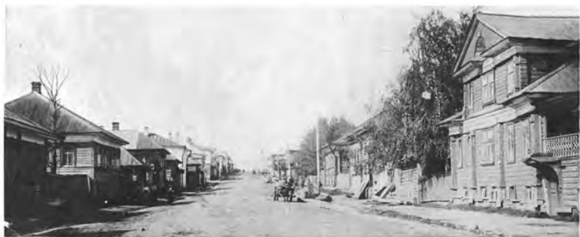
Улица Ярославская, 1915 год