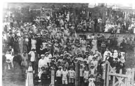
Детская площадка на Соборной площади