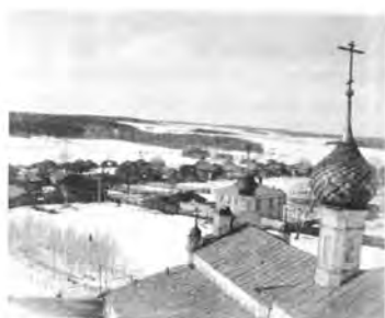
Вид с пожарной каланчи