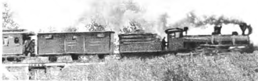
Один из первых поездов, пришедших на станцию Данилов в 1870 году