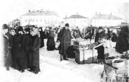
Торговля на Торговой площади