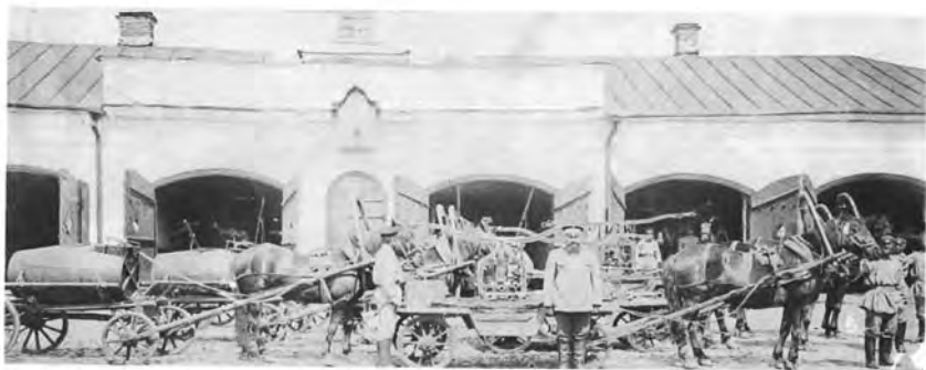
Вольная пожарная дружина, 1910 год