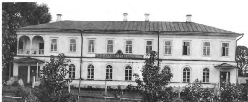
Высшее начальное училище