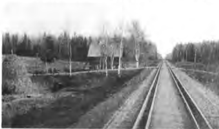
Узкоколейка. Впереди - Данилов