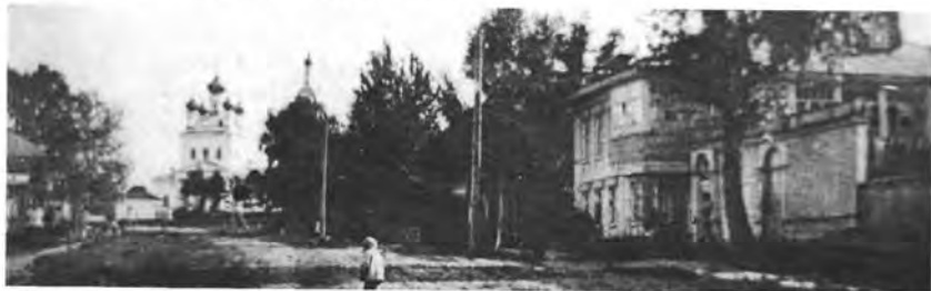
Вид на Преображенский храм