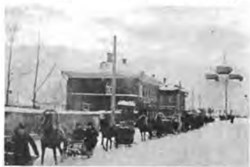
Улица Воскресенская, 1910 год, масленица