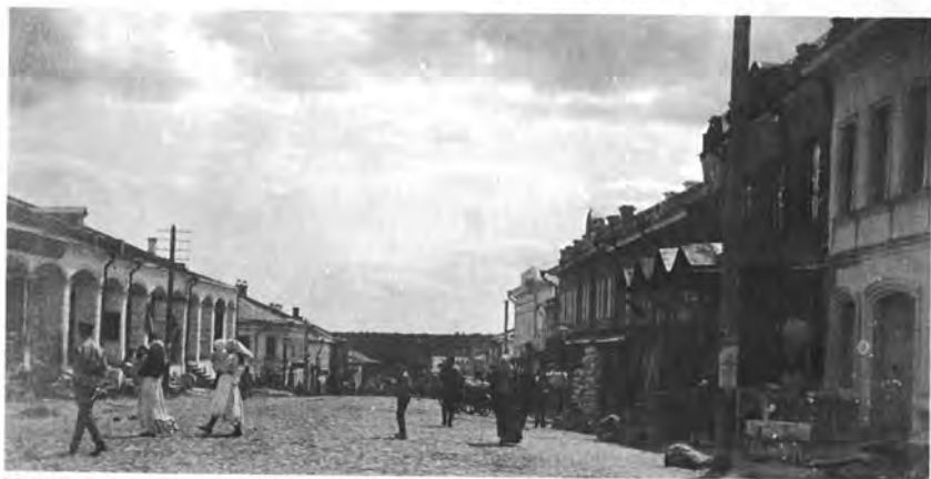
Улица Ярославская, 1914 год