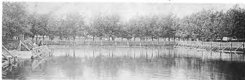
Преображенский пруд, 1914 год