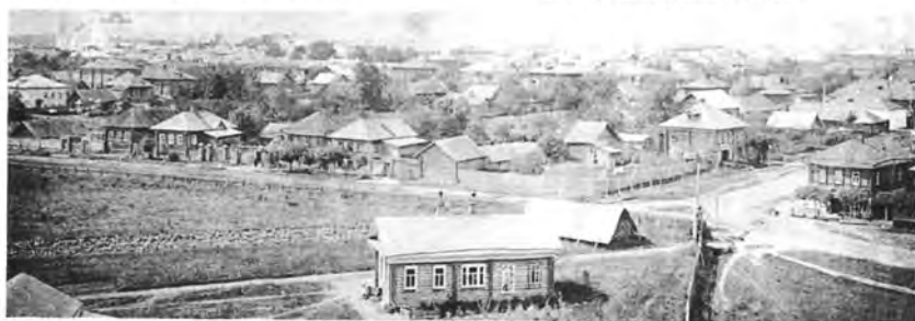
Улицы Луговая и Вятская, 1910 год