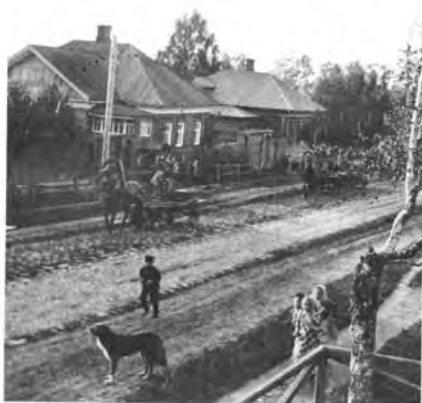
На улицах города