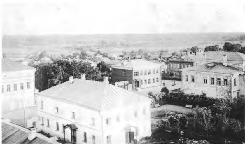
Вид на город с пожарной каланчи, 1913 год