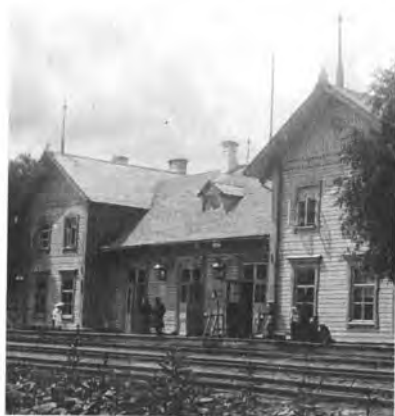
Вокзал станции Данилов, 1915 год