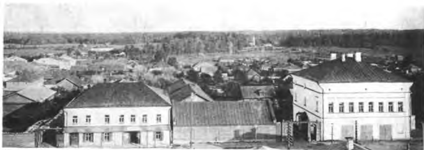
Улица Воскресенская, 1911 год