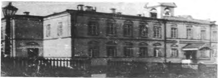
Уездная больница с церковью, 1913 год