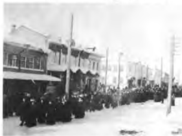
Улица Ярославская, 1910 год