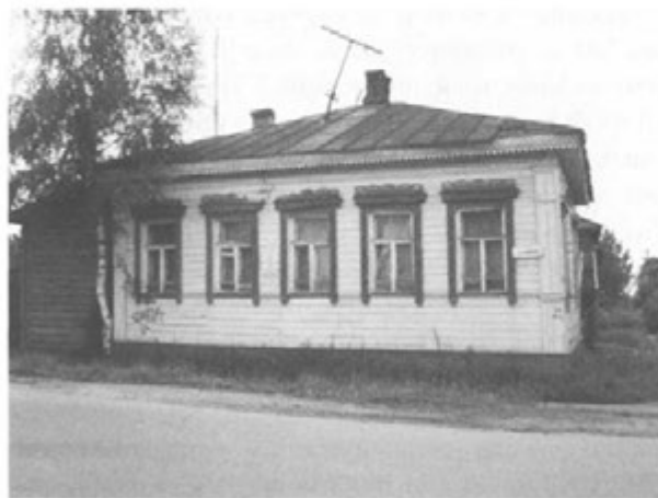
Город Данилов, ул. Карла Маркса, 52 - дом, где родился А. М. Смирнов

Из воспоминаний народного артиста Советского Союза Ролана Быкова: "Он закончил довольно горько, одиноко. Семьи Лешенька так и не создал - женщины были к нему несправедливы. Мечты об отцовстве так и не реализовал, а детей любил безумно. В перерывах между съемками его можно было найти только в окружении ребятишек, которые липли к нему, как к Деду Морозу, а он с огромной радостью, самозабвенно вырезал для них деревянные фигурки... Большой человек, весь растративший себя на то кино, которое могло его принять. Сколько радости он оставил в этих лентах людям!".