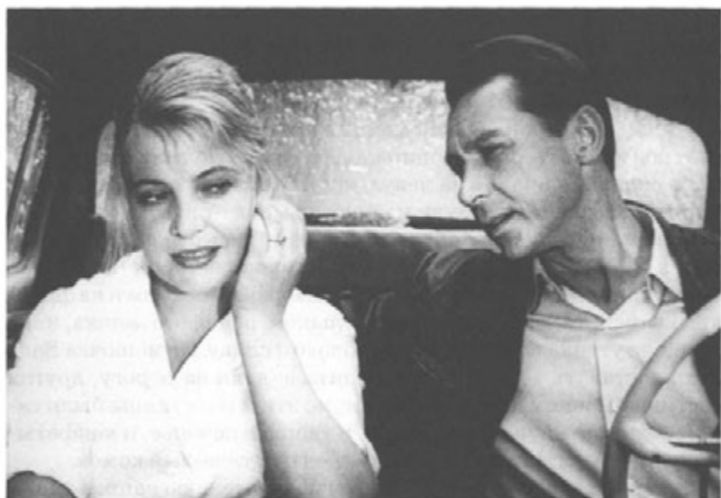
Кадр из фильма «Три тополя на Плющихе». В ролях Татьяна Доронина и Олег Ефремов

дела. Это повсеместно и, значит - и в будущем. Для чего жить - так безответно в главном, в том, что является подлинным и единственно ценным - бессребренность, духовность, красота и любовь? "Надо влюбляться", - кричит она, но влюбляться - это спасение на час, а в любовь она давно не верит и знает цену "парижской любви", которую оплакивает несколько лет. Раневская едет в Париж не жить (как Мизинова), а умирать, как сам Антон Павлович уехал умирать в Баденвейер.