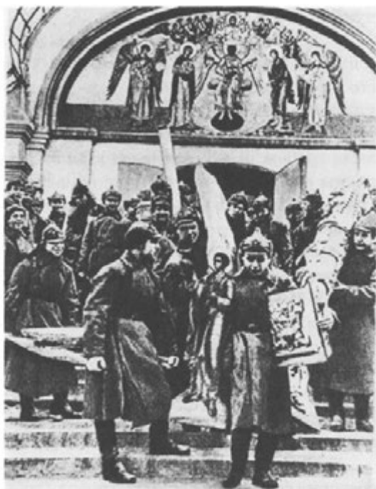
Изъятие ценностей из Симонова монастыря в Москве

В апреле и мае 1922 года комиссия обследовала 60 церквей, в том числе 2 старообрядческие, плюс 3 молебни. Все описи имущества церквей города и уезда были представлены в Губернскую ликвидационную комиссию церковно-монастырских имуществ. Ценности изъяты из 22 церквей уезда. Собрано 33 пуда 9 фунтов 94 золотника серебра, 10,25 золотника золота, 157 жем-