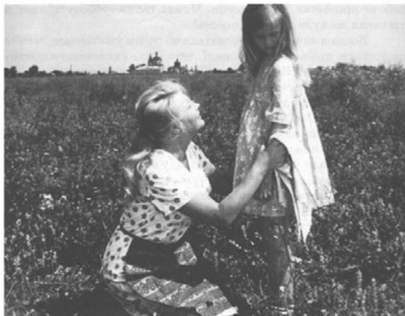
Кадр из фильма «Мачеха»