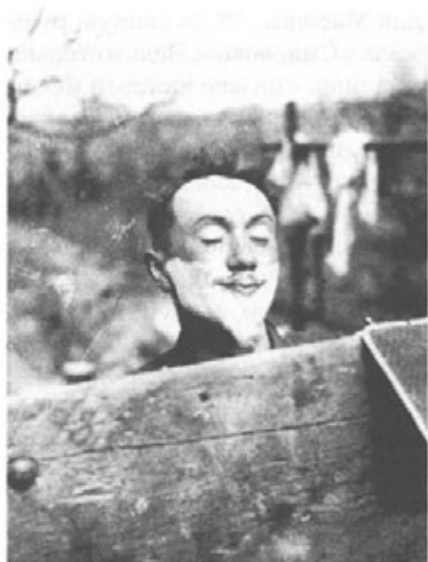
Алексей Смирнов. Фото военных лет

мека на какой-нибудь драматизм. Однако именно в этих ролях Смирнова и полюбила театральная публика. Любой выход этого актера на сцену вызывал у зрителей неопишуемый восторг и веселье. Особенно любили Алексея Макаровича дети.