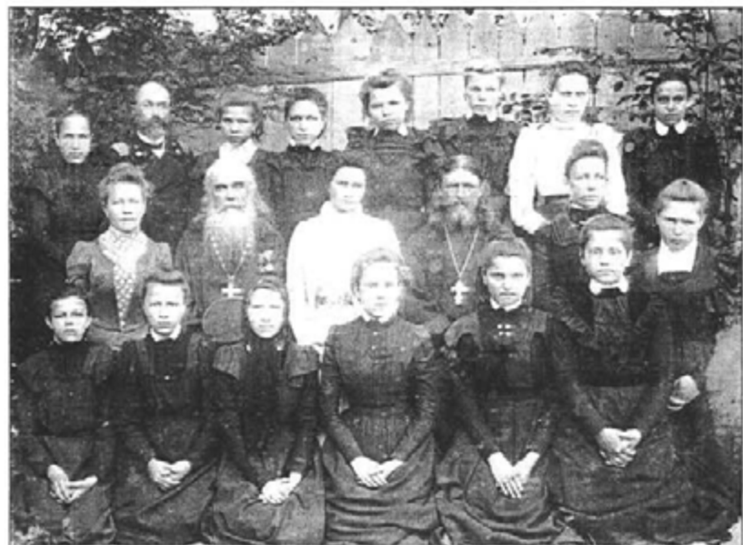
Учителя и ученицы двухклассной женской школы. Начало XX века.

В 2-классной школе изучались следующие предметы: Закон Божий (Священная история Ветхого и Нового Завета, учение о богослужении и катехизис), общая церковная история, церковное пение, русский язык, чистописание, церковно-славянский язык, оте-