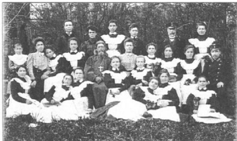
Двухклассная женская школа

Ежедневный распорядок был следующий. Воспитанницы вставали в 7 часов, после краткой молитвы пили чай и повторяли уроки. В 8 час. 30 мин. все вставали на общую молитву с участием приходя-