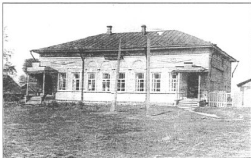
Женская начальная школа в г. Данилове.

форме - малой школы. Подобное училище из-за низкого финансирования, непопулярности среди горожан могло закрываться, и только энтузиазм некоторых жителей и твердая политика правительства позволяли восстановить школу и не давали ей потом затухнуть. С середины 1830-х гг. в уездных городах начали открываться женские пансионы или начальные школы. С конца 1830-х гг., после создания Министерства государственных имуществ, в этом ведомстве начали появляться "школы для поселянских детей", именно они составили особую сеть учебных заведений, послужившую основой в 1860-х гг. для земских школ.