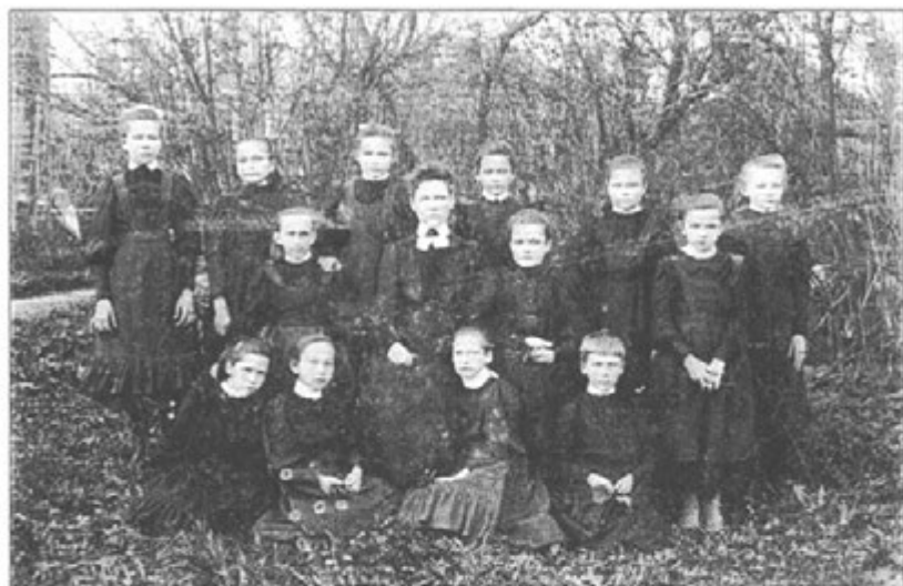
Двухклассная женская школа, выпуск 1906-1907 года.

ла выделялось 90 руб. Поставлены эти занятия были очень хороши, и воспитанницы по окончании курса умели скроить и сшить для себя одежду, вязать чулки, кружева, салфетки и т. д.