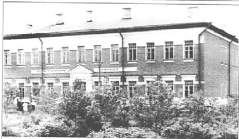
Здание Даниловского педагогического училища