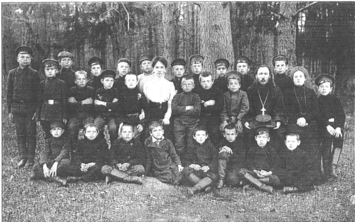
Учащиеся и учителя мужского городского училища, открытого в Данилово во второй половине XIX века.