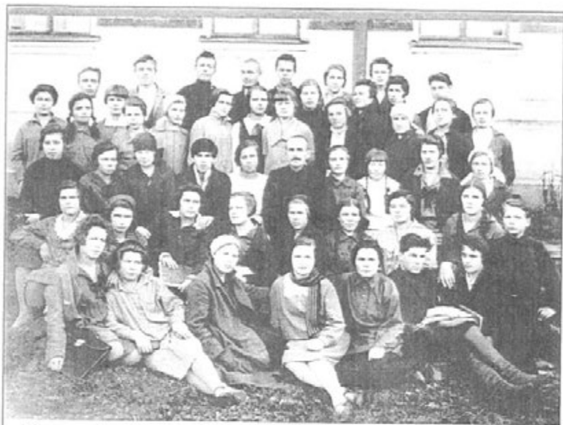
Хоровой кружок педагогического училища, октябрь 1929 г.