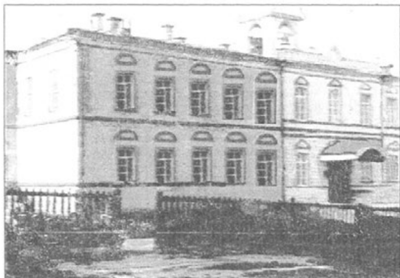
Здание земской больницы. Фото начала XX века.

До 2004 года на базе ЦРБ сделано два выпуска медицинских сестер.